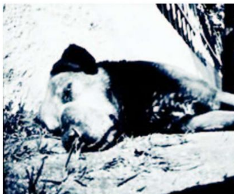
EL PROCESO ES EXTENSO Y RELAJADO, CUAL REFLEJO DE ESTA FOTO.

ubicado a un costado de un tarro de nescafé, genera una reacción con las sales de plata esparcidas en un papel fotosensible previamente cargado en el interior de lo que pasa a ser la cámara fotográfica. De esa manera, la luz dibuja en el papel lo que hay en el exterior, formando así una fotografía estenopeica.