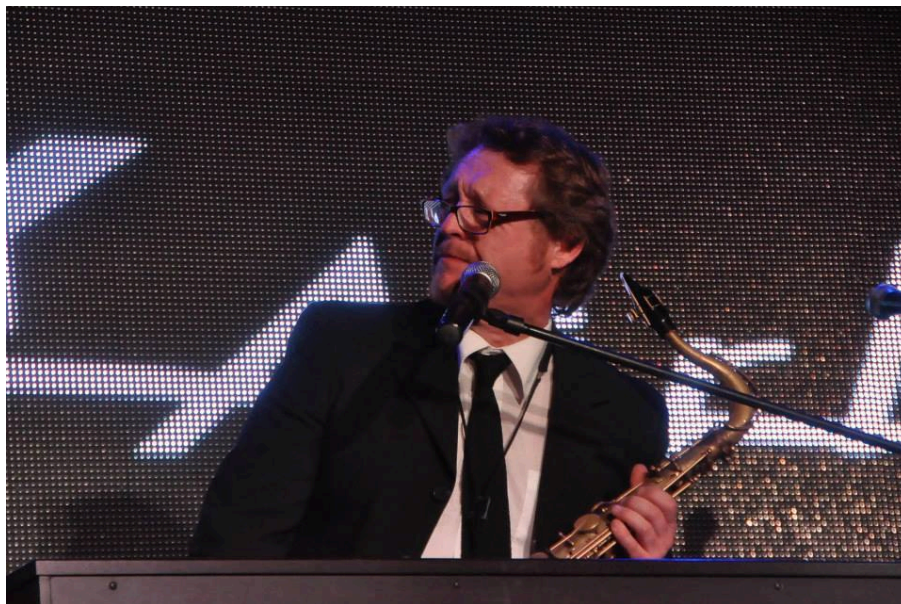
Casino Marina del Sol, Homenaje a Ray Charles (dirección Musical)